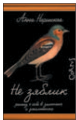
Наринская А. Не зяблик: Рассказ о себе в заметках и дополнениях. М.: АСТ; Corpus, 2016. — 288 с.

4 Книга журналиста Анны Наринской — своего рода критический дневник. Это коллекция размышлений о времени, человеке, искусстве и его способности изменить что-то в жизни общества - и об обществе, утратившем способность к диалогу. В сборник «Не зяблик» вошли как статьи, опубликованные ИД «Коммерсантъ», так и тексты, публикуемые впервые.