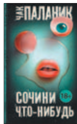
Паланик Ч. Сочини что-нибудь / Пер. с англ. Н. Абдуллина. М.: АСТ, 2016. — 320 с.

6 Если вы оказались в рассказе Чака Паланика, то будь вы хоть негром преклонных годов, хоть сексуально озабоченным подростком, хоть энтузиастом-вирусологом (не спрашивайте на что направлен его энтузиазм!), хоть бывшим стриптизером, хоть женщиной, кажется, проигрывающей битву с раком... в общем, скучать вам не придется!