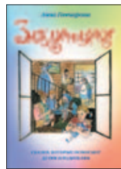
Гончарова А. Заклинайки. М.: Белый город, 2016. — 64 с.: ил.

7 Новая книга известной детской писательницы Анны Гончаровой рассказывает о большой и дружной семье заклинаек — волшебных существ, очень похожих на людей, но обладающих способностями творить маленькие и большие чудеса.