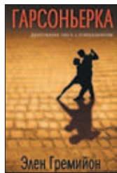
Гремийон Э. Гарсоньерка / Пер. с фр. А. Васильковой. М.: Фантом Пресс, 2016. — 352 с.