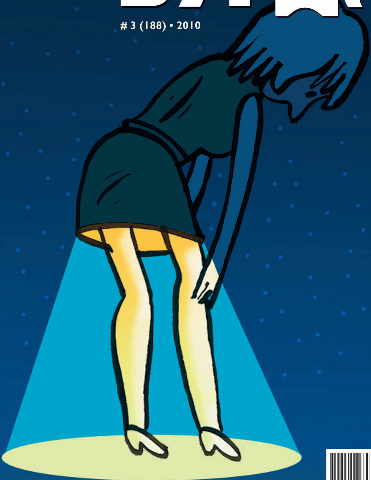
Рисунок Алексея Кивокурцева