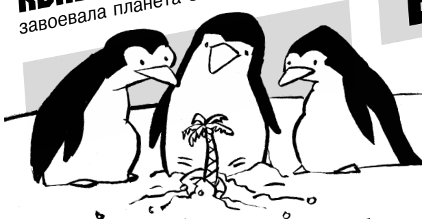
РИС. А. КИВОКУРЦЕВА (ПЕРМЬ)

ПРАВО ПРИНИМАТЬ КОНЕЦ СВЕТА-2012 завоевала планета Земля!