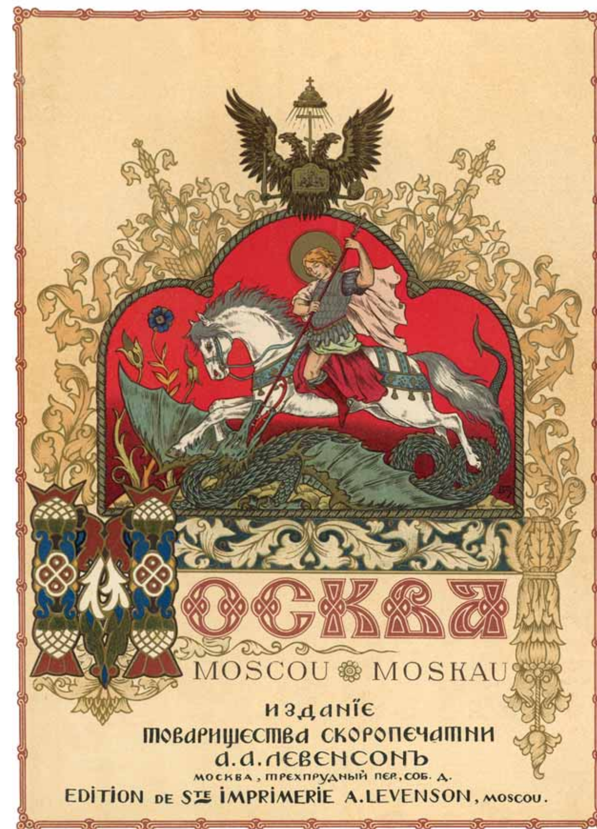
Б. В. Зворыкин. Титульный лист книги «Москва. Moscou. Moskau. Ее историческое прошлое и настоящее». М., 1912