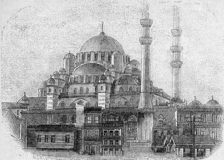
ТЕПЕРШІЙ ВИДЪ СВ. СОФІИ — МѢСТА СЛУЖЕНІЯ СВ. І. ЗЛАТОУСТА.