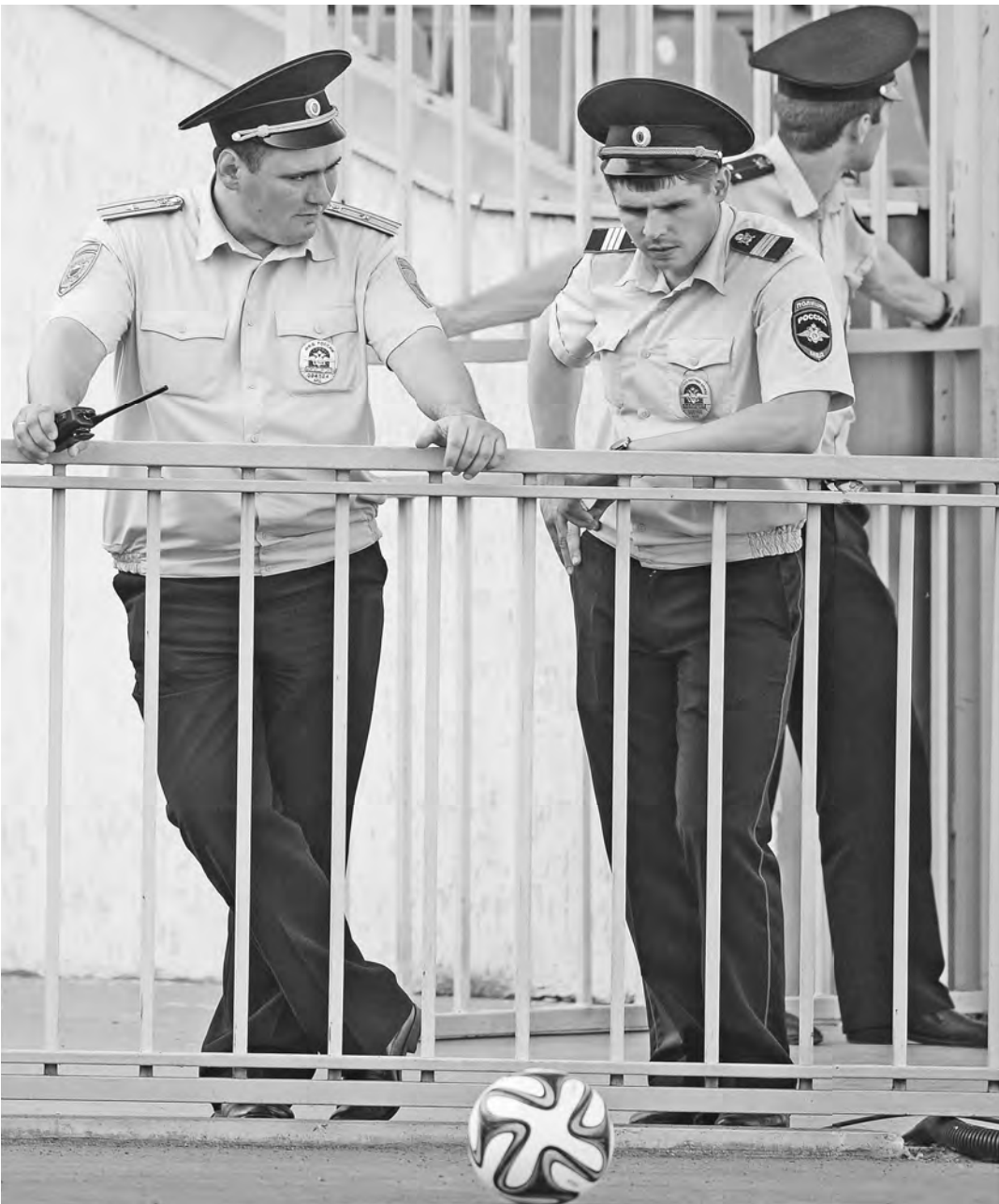
С футбольными хулиганами на чемпионате мира-18 «по-взрослому» разберутся полиция и Нацгвардия.

В президентском указе учтено все, даже возможные проникновения иностранных террористов и связанные с этим дипломатические осложнения. Предотвратить это призваны в том числе и входящие в штаб заместитель директора Службы внешней разведки и посол по особым поручениям МИД России. Гражданские ведомства там представля-