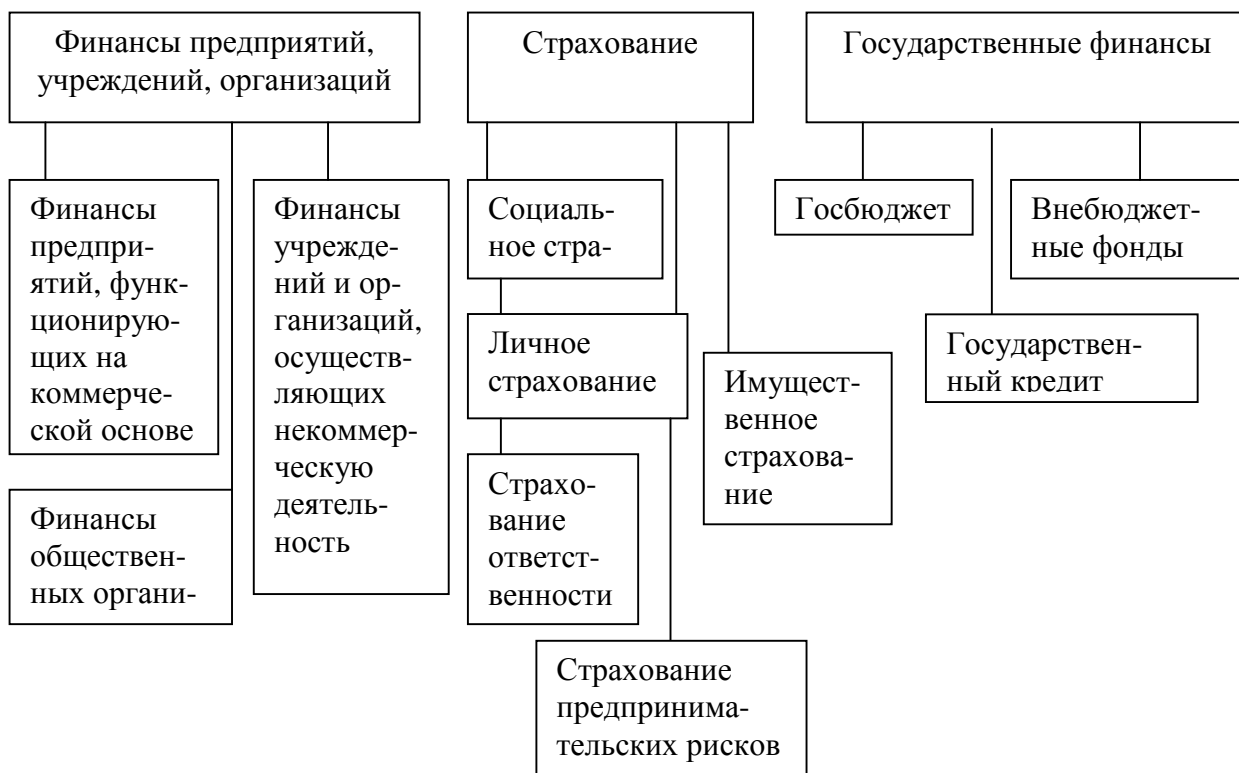
Рис. 2. Финансовая система РФ

Общегосударственные финансы включают: государственный бюджет, внебюджетные фонды, государственный кредит и фонды страхования, финансы хозяйствующих субъектов – финансы предприятий различных форм собственности (рис. 2).