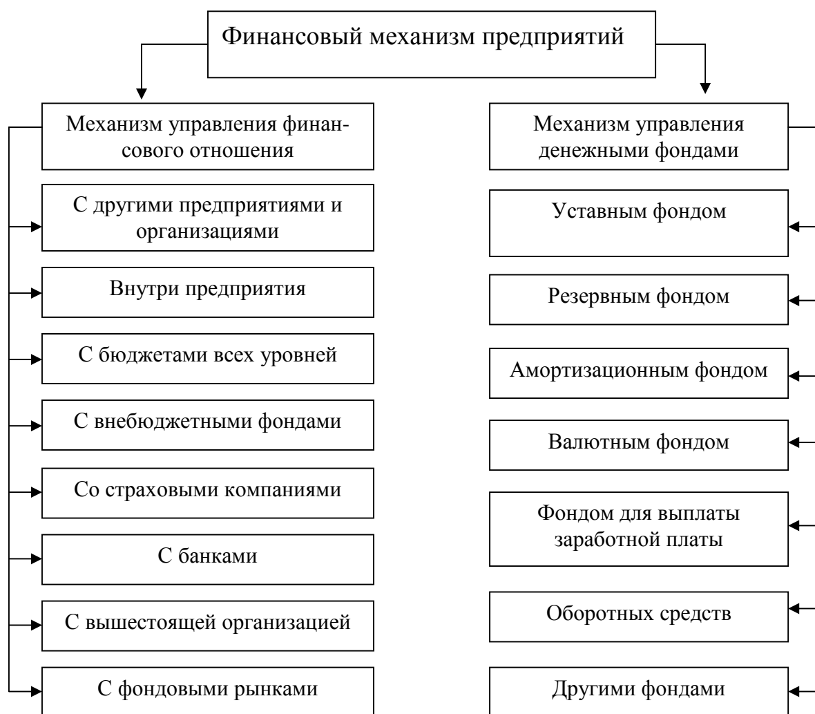
Рис. 4. Система управления финансами предприятий