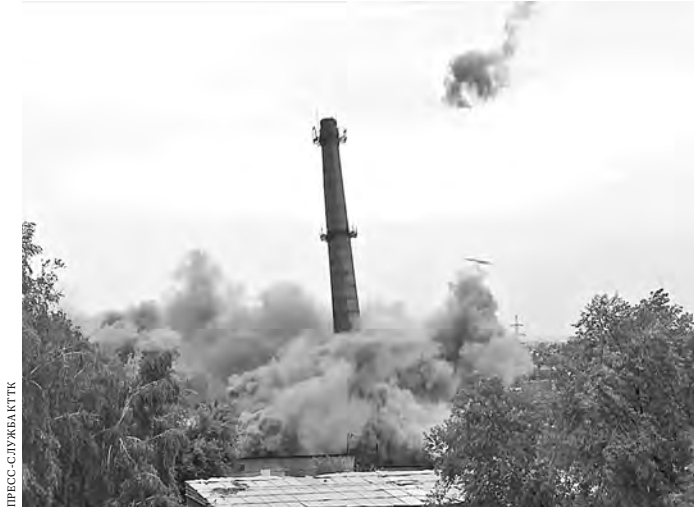
После сноса старой котельной ее территория будет очищена и передана городу под жилую застройку.

— Единовременная страховая выплата направляется супруге или детям погибшего, — пояснили в Фонде.