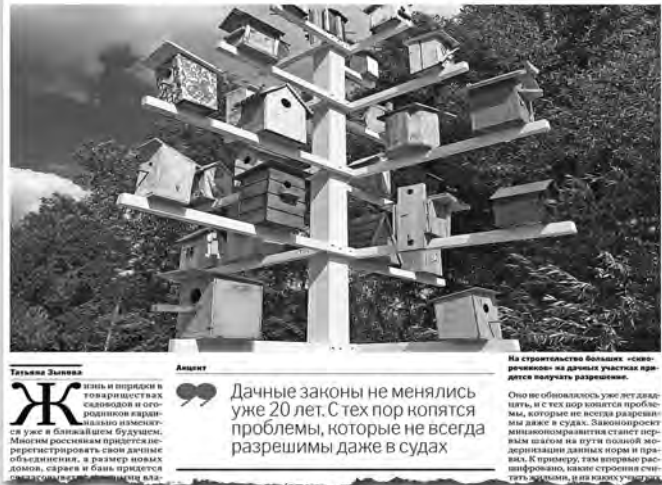
О подготовке нового закона для дачников «РГ» писала 22 августа.

ПРАВО Впервые назначен штраф за отказ предоставить информацию по адвокатскому запросу