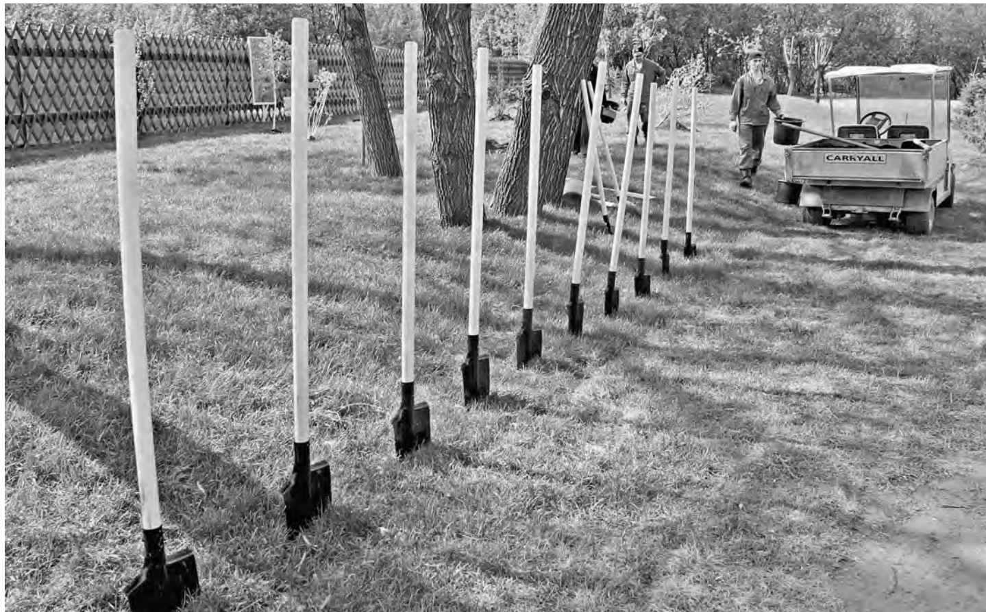
Дачников пересчитают и приравняют к местным жителям.