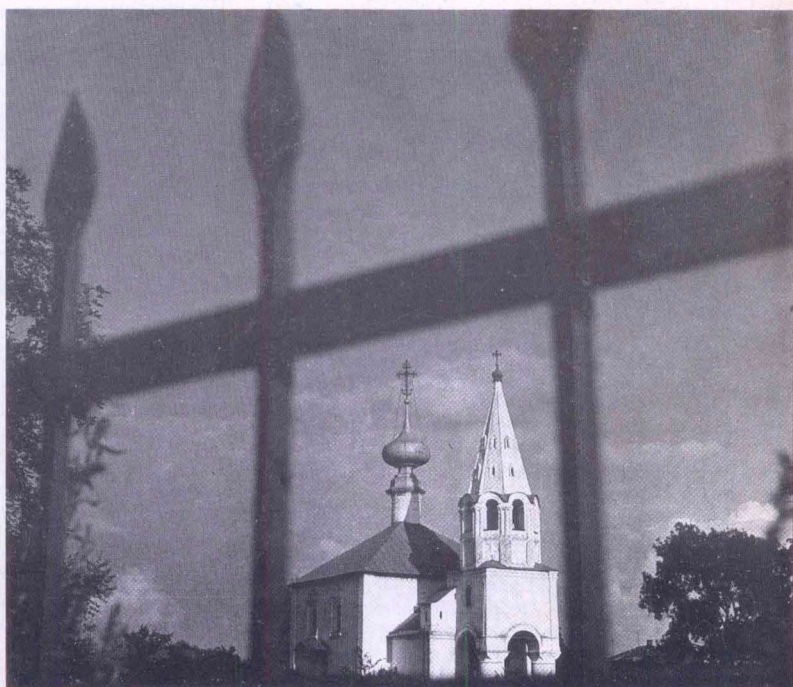
Церковь св. Иоанна Предтечи