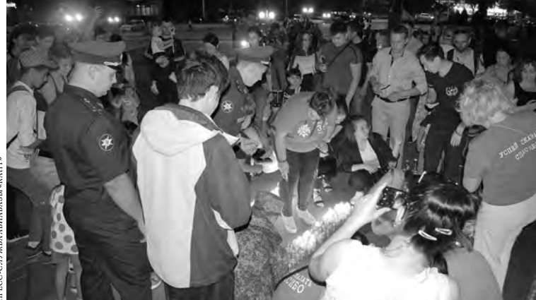
ПРЕСС-СЛУЖБА ВИАБАЗЫ «КАНТ»

На площади Победы в Бишкеке прошла акция «Свеча памяти», приуроченная к 78-й годовщине начала Великой Отечественной войны. В мероприятии приняли участие российские военнослужащие из авиабазы ОДКБ «Кант» и члены их семей. На площади из свеч выложили слова «Мы помним...» и пятиконечную звезду.