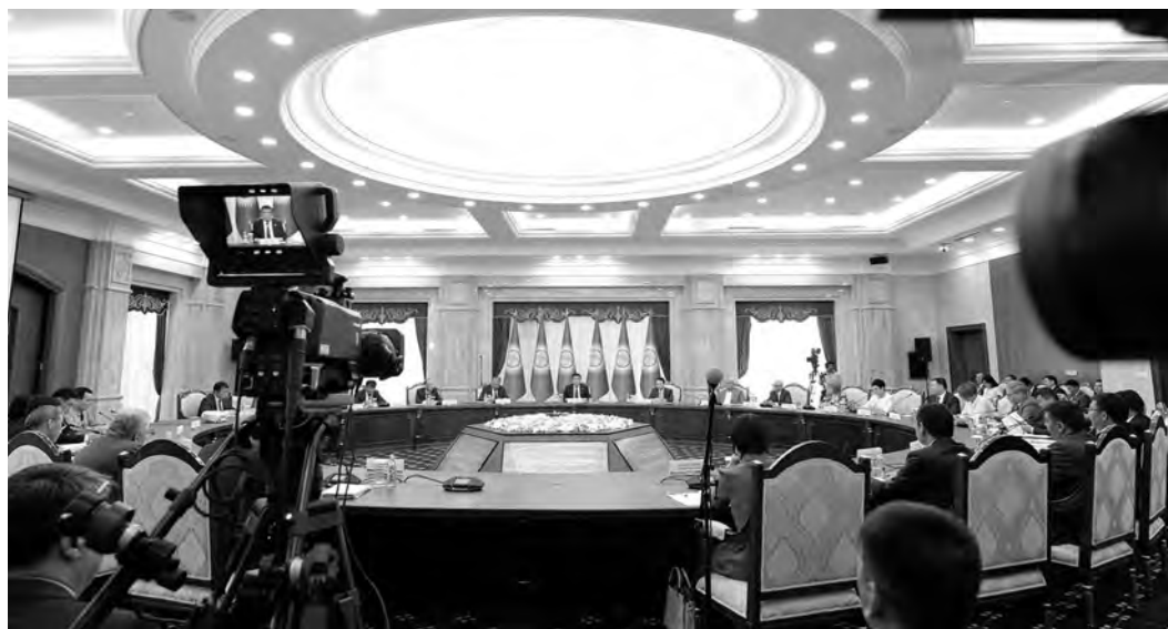
ПРЕСС-СЛУЖБА ПРЕЗИДЕНТА КР

Глава Киргизии призвал модернизировать экономику и страну