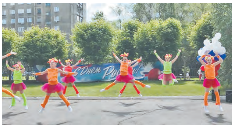
ПРЕСС-СЛУЖБА ФСНКЦ ФМБА РОССИИ