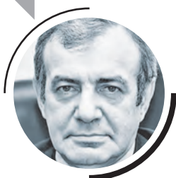
ЮРИЙ СААКЯН, ГЕНЕРАЛЬНЫЙ ДИРЕКТОР ИНСТИТУТА ПРОБЛЕМ ЕСТЕСТВЕННЫХ МОНОПОЛИЙ (ИПЕМ)