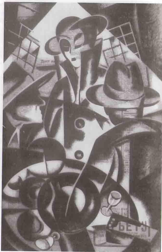
Н.П. Садовников. Трое, конец 1920 – начало 1930-х (?)