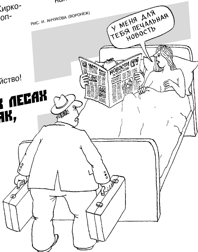
РИС. И. АНЧУКОВА (ВОРОНЕЖ)

НАНОТЕХНОЛОГИИ развиваются семимиллиметровыми наношагами!