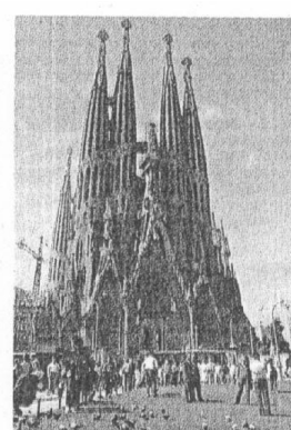
La Sagrada Familia