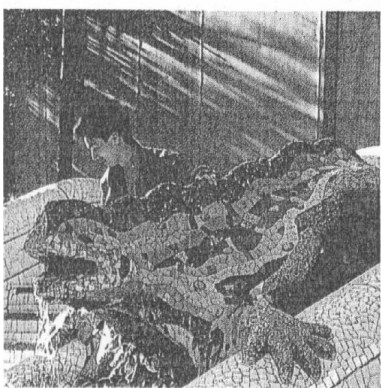
El parque Güell