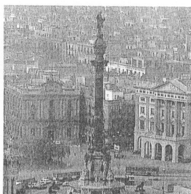
La estatua de Colón