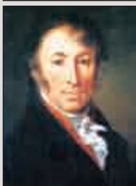
Основан Н. М. Карамзиным в 1791 году. Возобновлен в 1991 году

Литературно-художественный, историко-краеведческий ежемесячный журнал