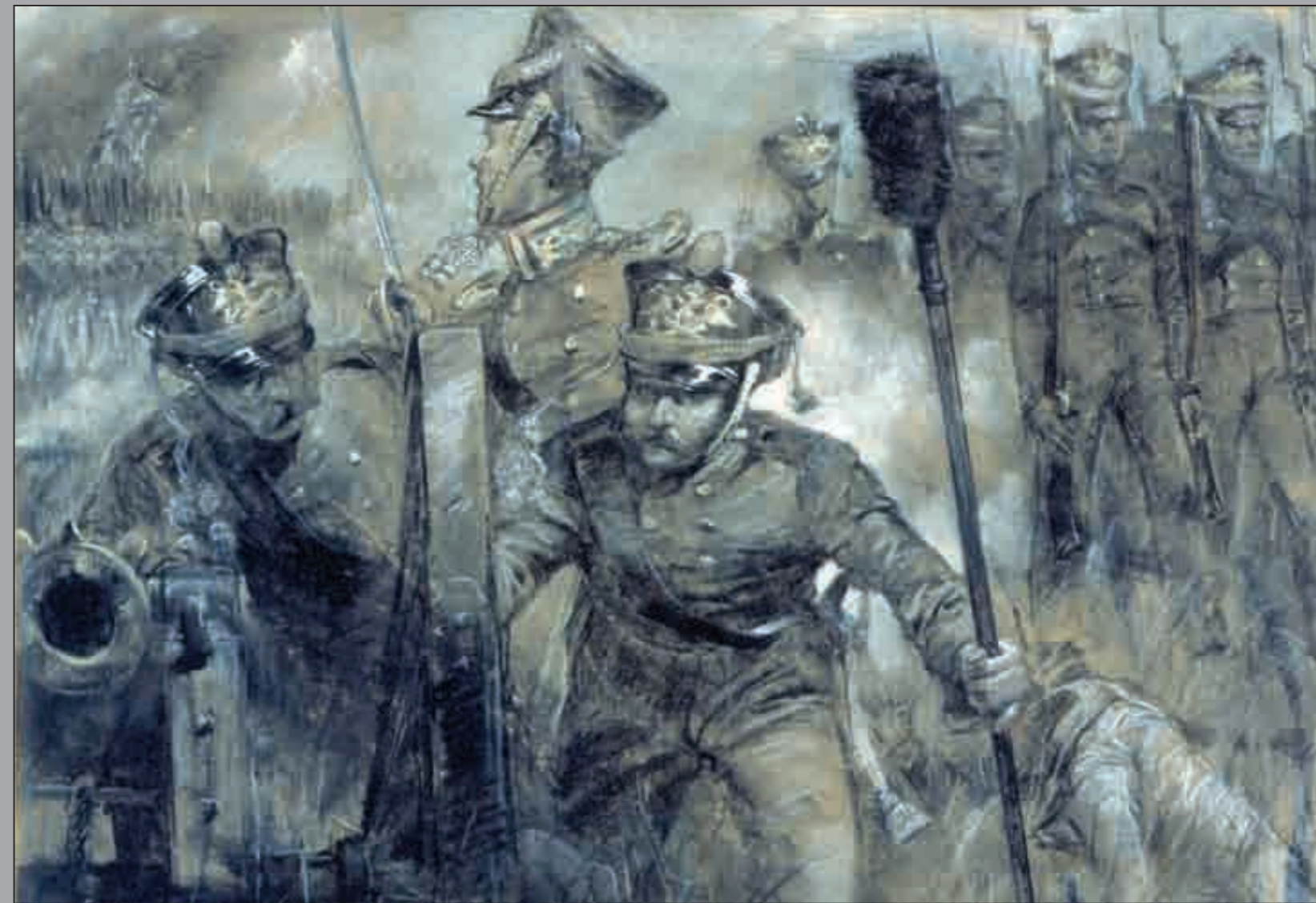
А. А. ТРОНЬ. ГВАРДЕЙСКИЙ ЭКИПАЖ В БОРОДИНСКОМ СРАЖЕНИИ. КАРТОН, УГОЛЬ, ПАСТЕЛЬ. 1988 ГОД