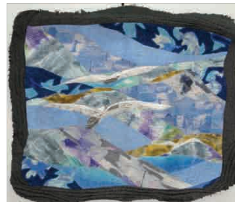
Чайки. Панно. 2008 год