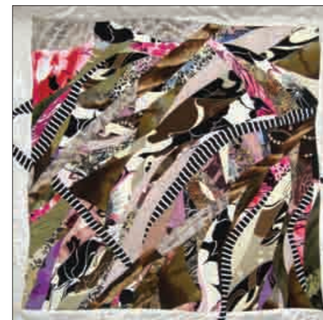
Страница жизни. Панно. 2009 год