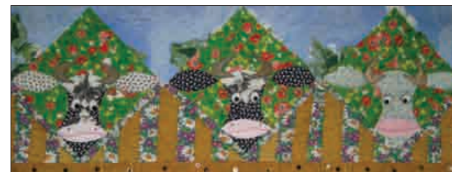
Сельская идиллия. Панно. 2005 год