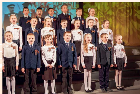
На 1-й странице обложки: Дети поют в хоре на концерте в честь Дня Победы.