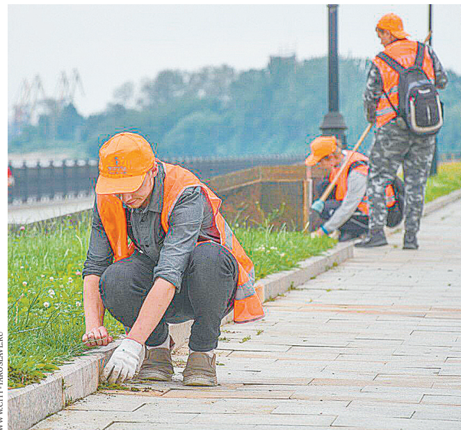
Молодежная трудовая бригада работает в регионе с 2004 года.