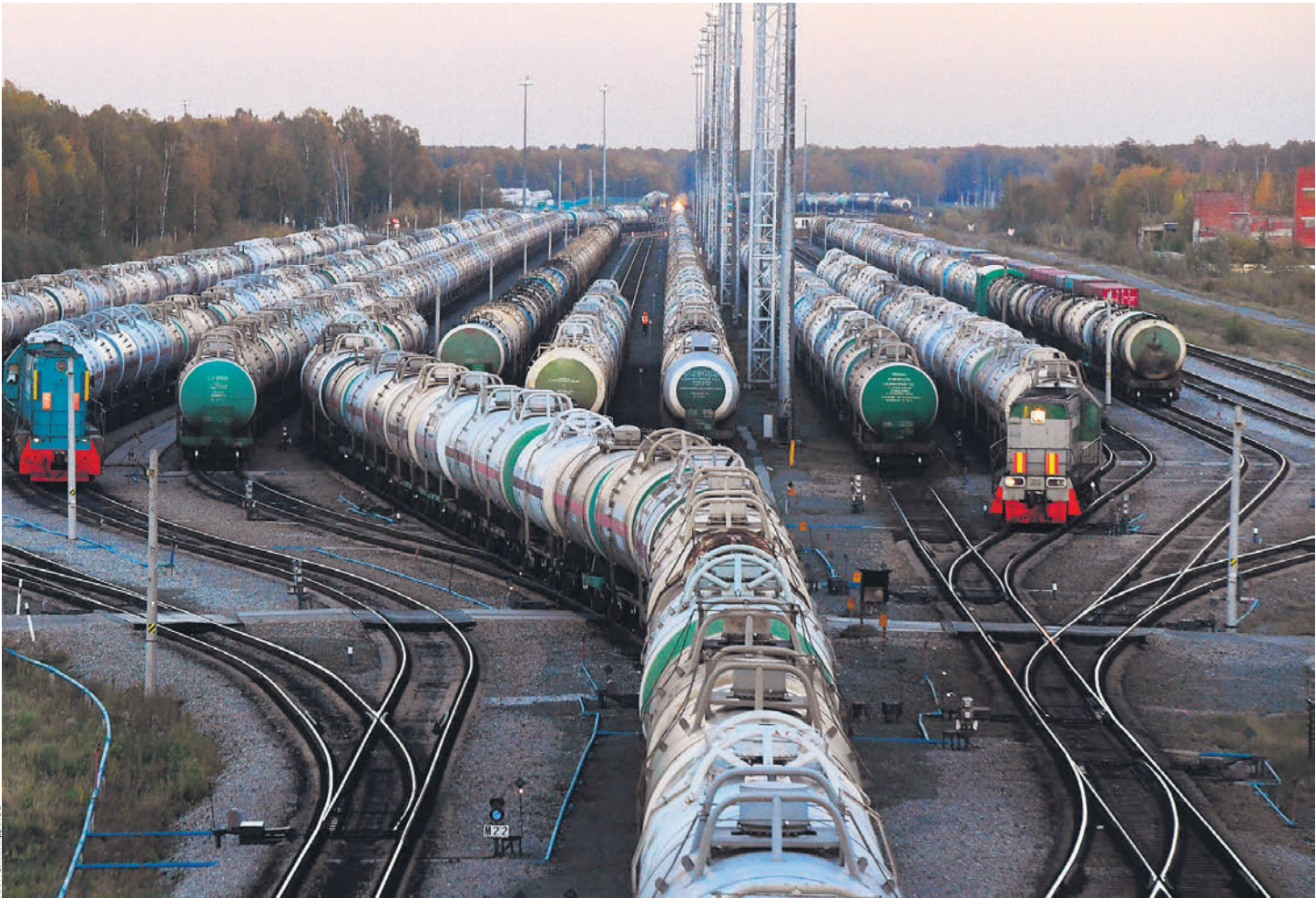
Стоимость топлива в России падала сильно, но недолго, а полностью ликвидировать дефицит до сих пор не удалось

Эксперт считает, что предпосылки для дальнейшего подорожания бензина и дизтоплива даже в условиях ограничений пока нет: «На бирже достаточно предложения, а серый экспорт перекрыт». Господин Фаттахов отмечает, что в ближайшее время начнется снижение спроса на дизтопливо в связи с окончанием посевной, при этом аграрии сейчас обеспечены топливом.