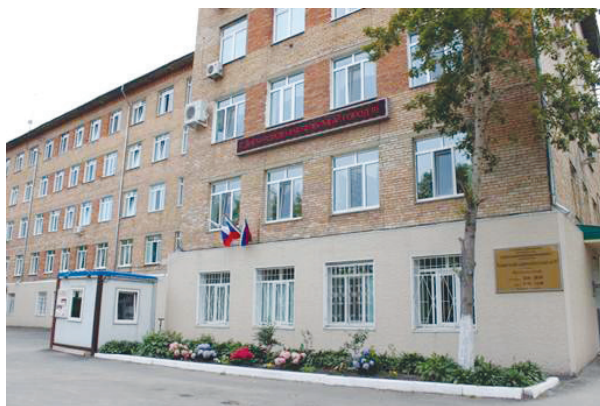
Современный облик роддома №3 г. Владивостока (2016 год).

Родильный дом №3 Владивостока – одно из старейших лечебных учреждений Приморского края. Его официальная история берет начало в далеком январе 1967 года, когда состоялось торжественное открытие учреждения.