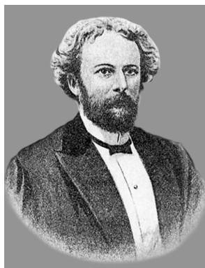
Рис. 1.1. Владислав Краевский (1841–1901)

Отец русской атлетики доктор В.Ф. Краевский ( рис. 1.1 ) в свое время говорил: «Я уверен, что за тяжелой атлетикой в России большое будущее. Такой массы исключительно сильных людей, мне кажется, нет ни в одной другой стране» [4].