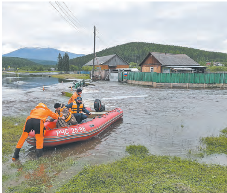
ПРЕСС-СЛУЖБА ГОСЧС ПО КРАСНОЯРСКОМУ КРАЮ

В Манском районе река Мана подтопила 24 жилых дома и при-