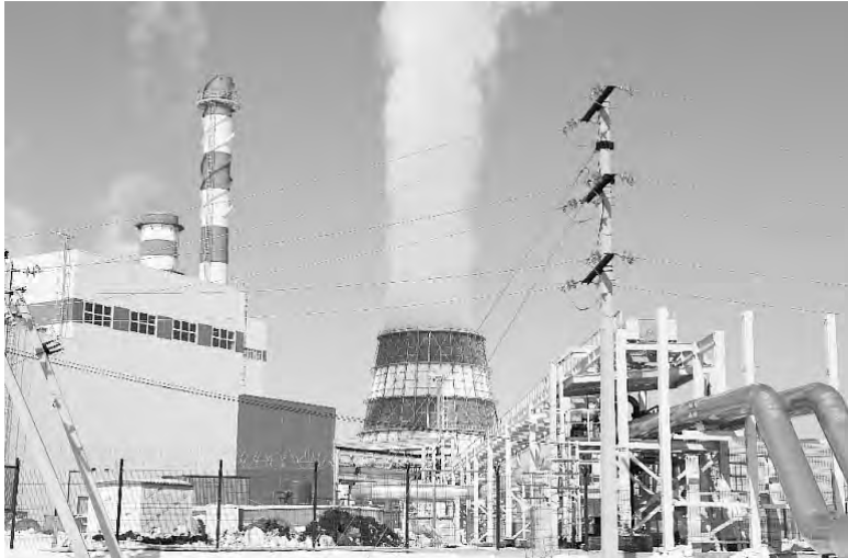
Мощности ТЭЦ позволят обеспечить энергией новый микрорайон.