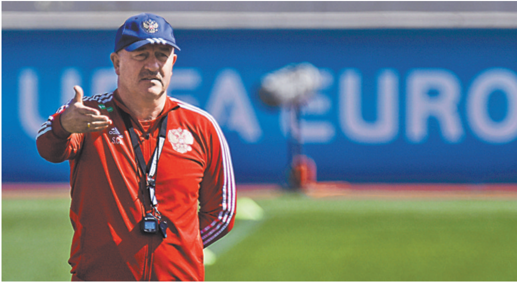
Наставник нашей сборной Станислав Черчесов не скрывал, что рассчитывает оформить путевку на Евро на Кипре.

* — ОЧЕ — отборочный турнир чемпионата Европы, ОЧМ — отборочный турнир чемпионата мира, МТ — международный турнир.