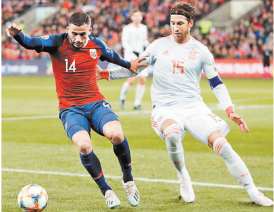
Игра с Норвегией стала 168-й за сборную для Серхио Рамоса. Он стал рекордсменом своей команды по этому показателю.

Впрочем, как и в случае с испанцами, вряд ли эта осечка сильно повлияет на шансы «львов» на выход в финальную стадию Евро. Они продолжают лидировать в своей группе и чувствовать себя, в общем, комфортно. В активе англичан и чехов по 12 очков, но при этом у Гарри Кейна и компании на один матч меньше.