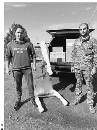
Активисты ОНФ доставили на передовую столь нужную медицинскую технику.