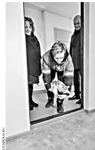
По традиции первой в дом зашла кошка.

— Не знаю, как моим соседям будет жить, потому что фортепиано в квартире поставлю обязательно. Думаю, станут меня слушать,