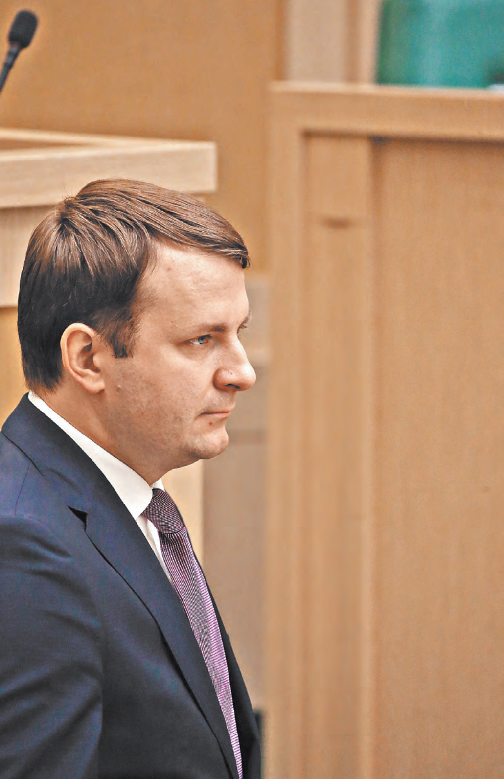
Максим Орешкин напомнил, что цикл экономического роста длится третий год подряд со средним темпом около двух процентов. Но такие темпы «не могут считаться достаточными».

Минэкономразвития по поручению президента подготовило план дополнительных мер по повышению темпов роста. Главная задача плана — добиться ускоренных темпов роста инвестиционной активности и роста спроса на труд. Тем самым планируется достичь устойчивого