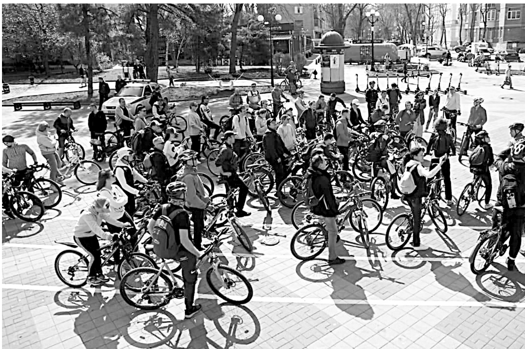
ПРЕСС-СЛУЖБА АДМИНИСТРАЦИИ ГОРОДА

С 16 МАЯ по 20 июня на водоемах Астраханской области будет действовать запрет на любительский лов рыбы в соответствии с правилами рыболовства, сообщили в пресс-службе губернатора. Также с 1 апреля по 30 июня действует табу на добычу раков. Ловить рыбу нельзя в волжском запретном предустьевом пространстве, нерестилищах и зимовальных ямах. Ставить сетки запрещено.