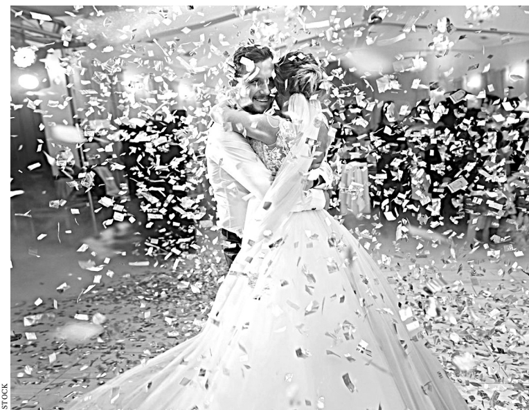
Придется астраханцам забыть и о традиции осыпать молодоженов лепестками роз, монетами.