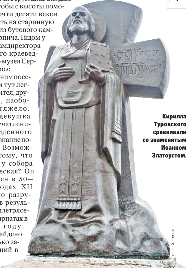
Кирилла Туровского сравнивали со знаменитым Иоанном Златоустом.