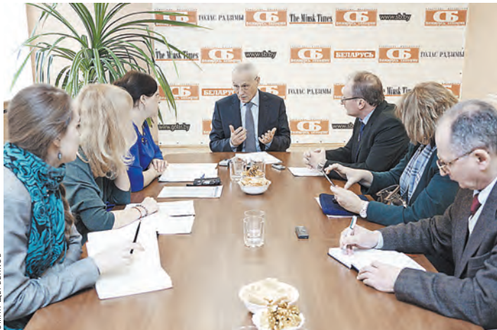
Встречи с Григорием Рапотой для журналистов «СОЮЗа» крайне важны: он ведь не только Госсекретарь Союзного государства, но и председатель Редакционного совета газеты.