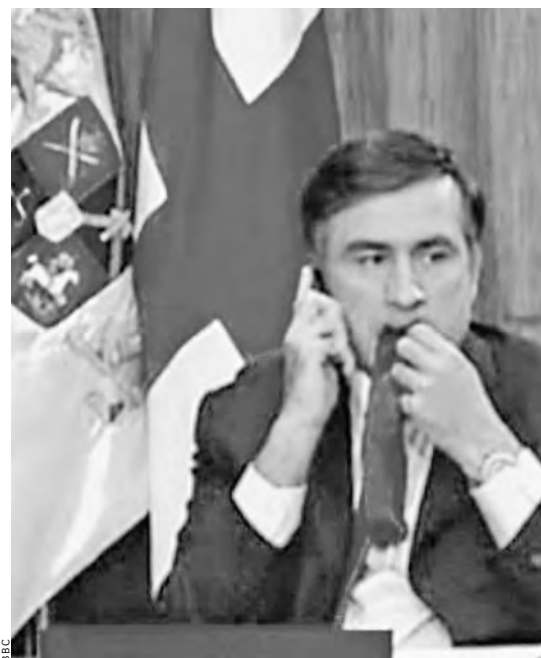
Таким Саакашвили войдет в историю: жующим галстук, звонящим в Вашингтон, чтобы попросить совет и помощь у своих хозяев.