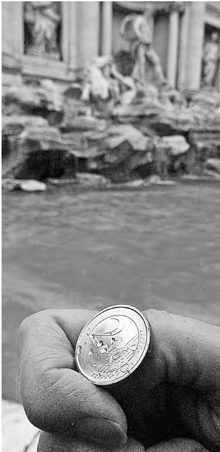
Потери туристам будут компенсировать из прибыли нового фонда.

деньги Дефицита иностранной валюты в России осенью не ожидается