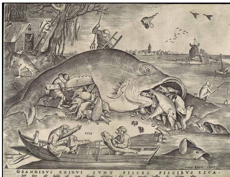
П. Брейгель. «Большие рыбы пожирают малых рыб» (1557)