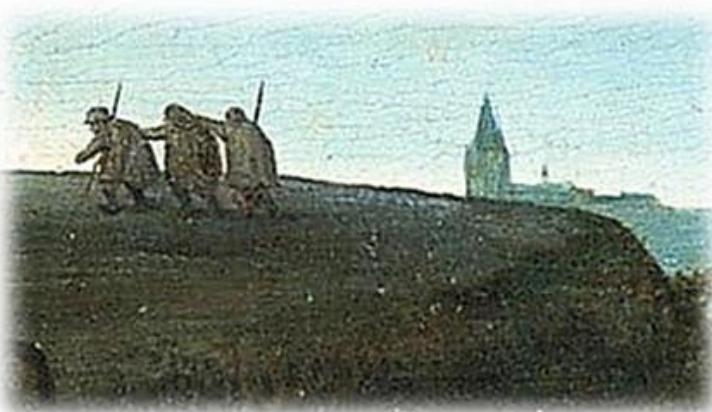
П. Брейгель. «Мир вверх дном» (фрагменты)