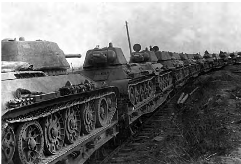
Танки Т-34 доставлялись на фронт по железным дорогам