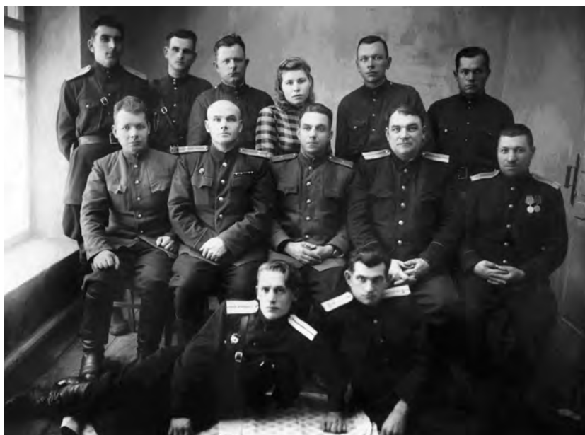
Личный состав Будёновского РО НКВД Воронежской области