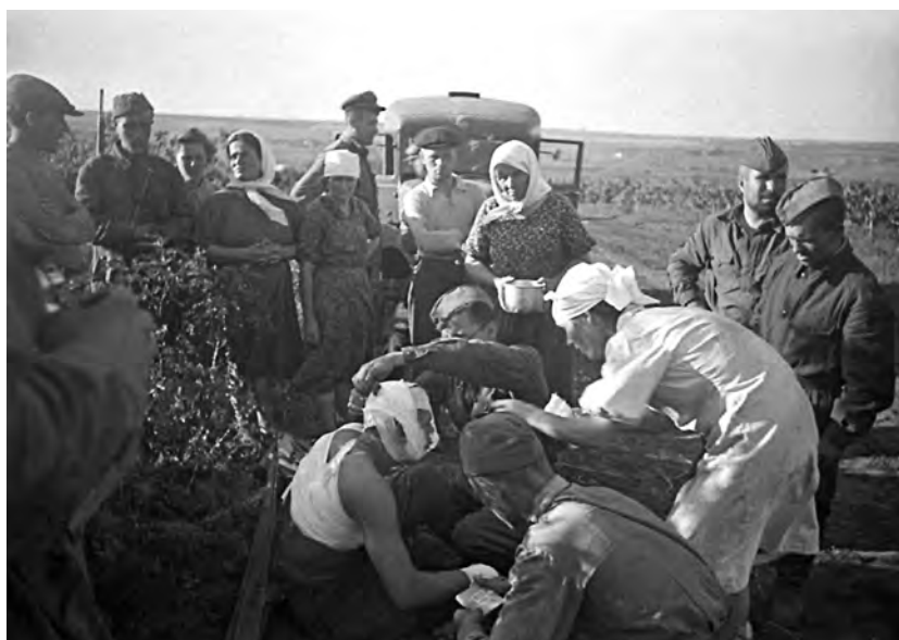
Несмотря на трудности и голод, народ и армия были едины