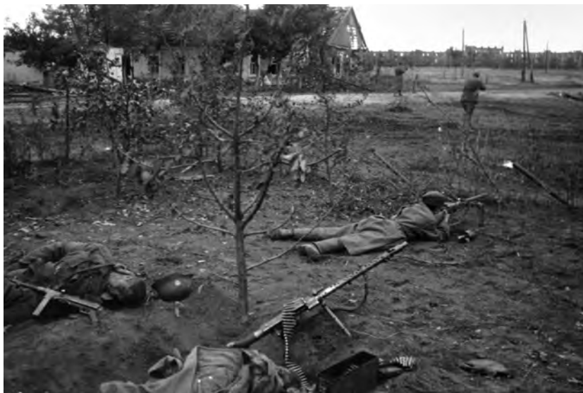
Бойцы подразделения войск НКВД по охране тыла ведут бой с остатками банды из числа военнослужащих вермахта