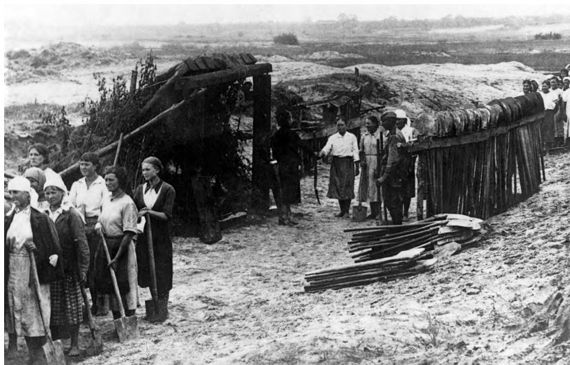
Выдача инвентаря женщинам для строительства железнодорожной ветки Старый Оскол–Ржава