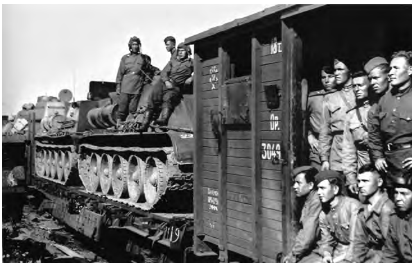
Воинский эшелон с бойцами и командирами Красной Армии следует к месту назначения