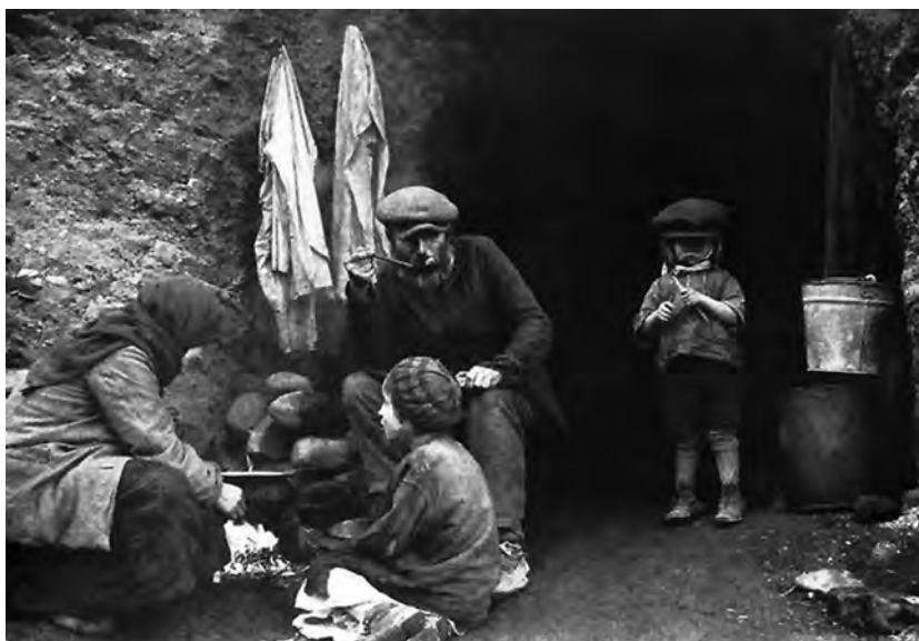
Бытовые условия советской семьи, пережившей оккупацию