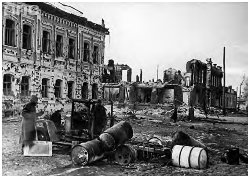
После освобождения г. Белгород лежал в руинах