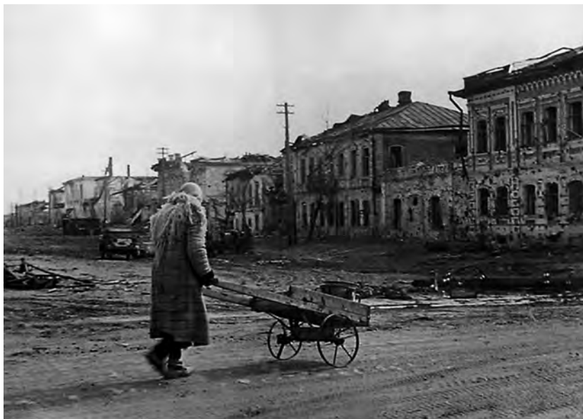
Голод и страдания принесла война жителям г. Белгорода