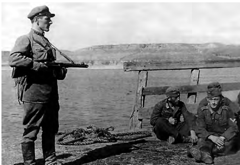
Боец подразделения войск НКВД по охране тыла конвоирует взятых в плен солдат вермахта