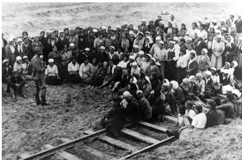
Одно из собраний женщин-тружениц в период строительства железнодорожной ветки Старый Оскол–Ржава