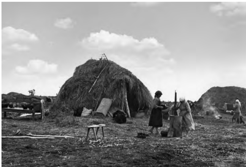
Оставшиеся без крова в годы войны мирные жители пытались обустроить свой быт