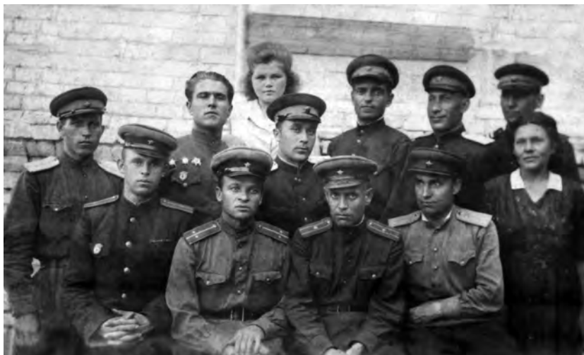
Личный состав Алексеевского РО НКВД Воронежской области