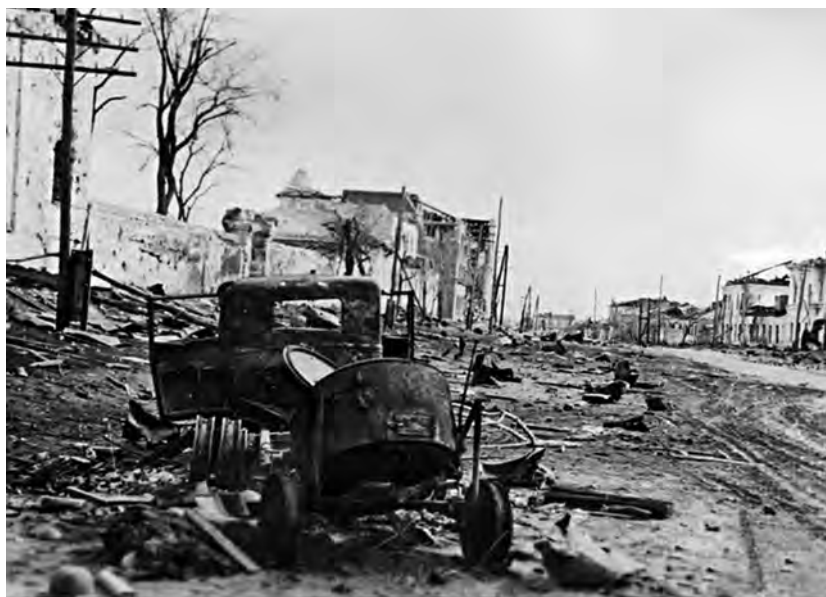
Страшное наследие, оставленное оккупантами