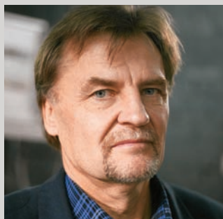
ВАЛЕРИЙ КЛАМОВ/GRINBERG AGENCY