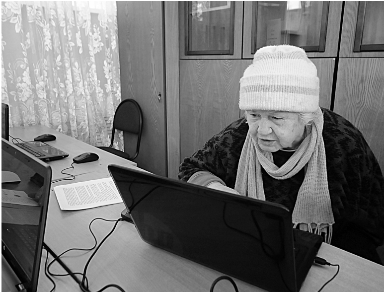
Для пенсионеров, окончивших курсы, компьютер становится обычным бытовым прибором.

Добравшись за полцены до Якутска, северяне могут «пересест» на другую, федеральную программу субсидирования авиаперевозок, которая действует в те же сроки. Из столицы республики самолеты до глубокой осени будут возить пассажиров по льготному тарифу в Москву, Анапу, Сочи, Санкт-Петербург и Владивосток. Такие же цены будут действовать и в обратном направлении.