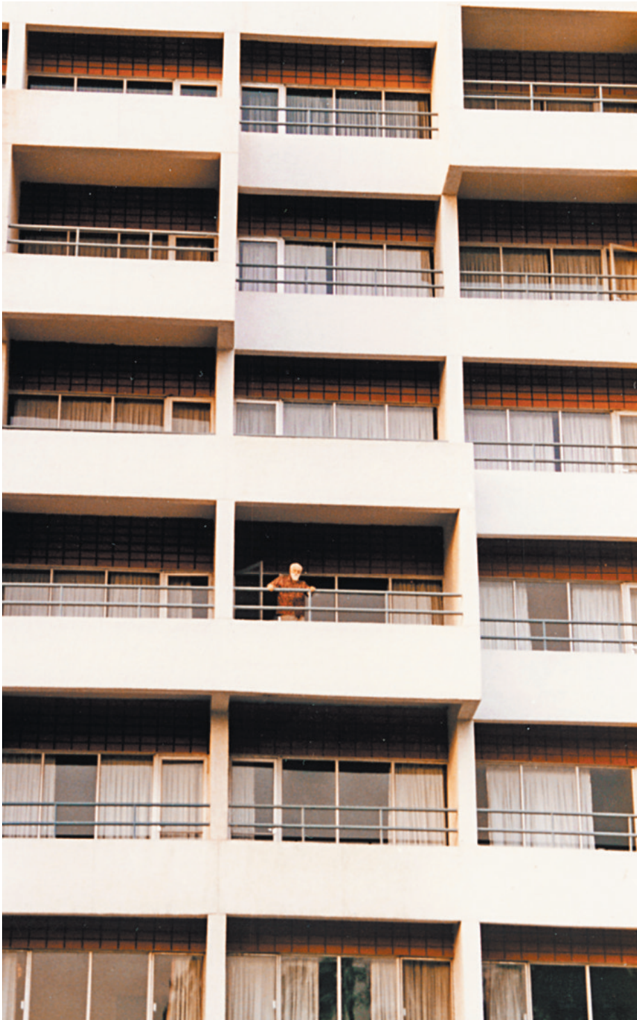
Он помахал мне рукой с балкона отеля «Ашока».