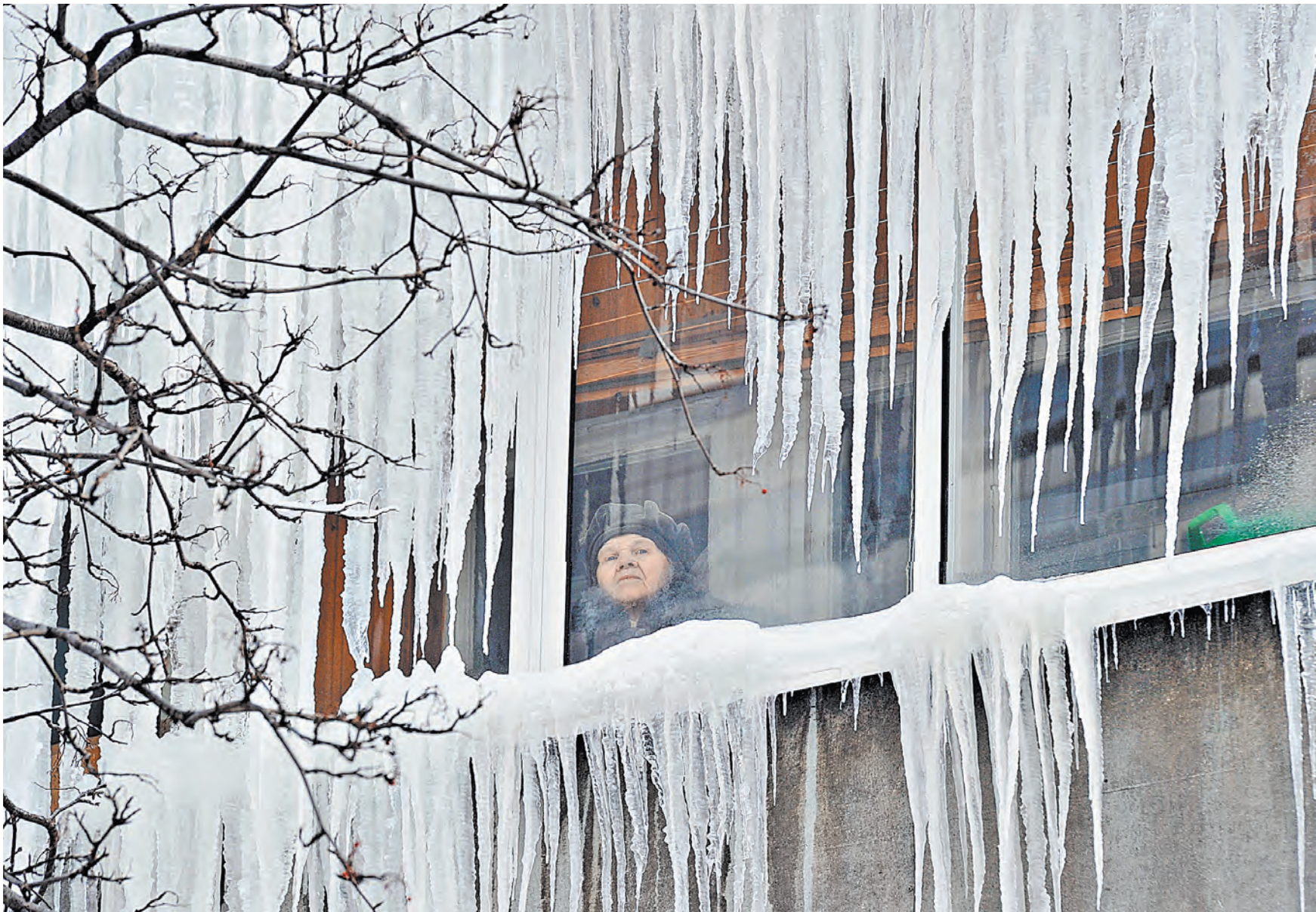
Аварии, из-за которых десятки тысяч людей остались без тепла, произошли уже в 17 российских регионах.