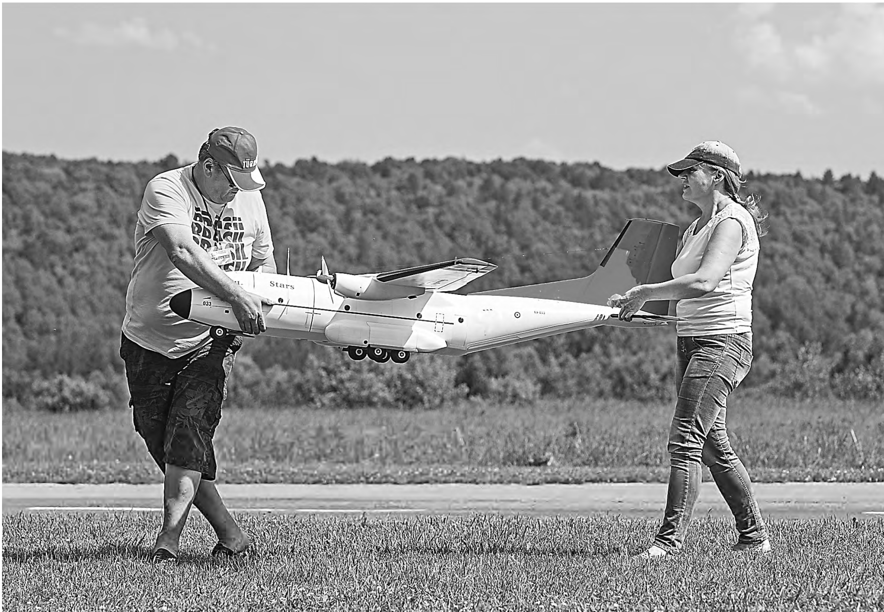
Субсидии подтолкнул авиакомпании конструировать востребованные региональные маршруты. На некоторых действующих направлениях льготные билеты раскупаются за полчаса.