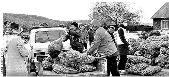
Каждый пострадавший увез домой по 90 килограммов картофеля.