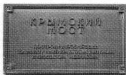
Дом № 9 на ул. Музейной, где вырос Б.П. Константинов Мемориальная доска на Крымском мосту