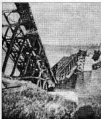
Обломки моста через реку Новый Днепр в г. Запорожье

Одноарочный мост 1930-х гг. через реку Старый Днепр в г. Запорожье