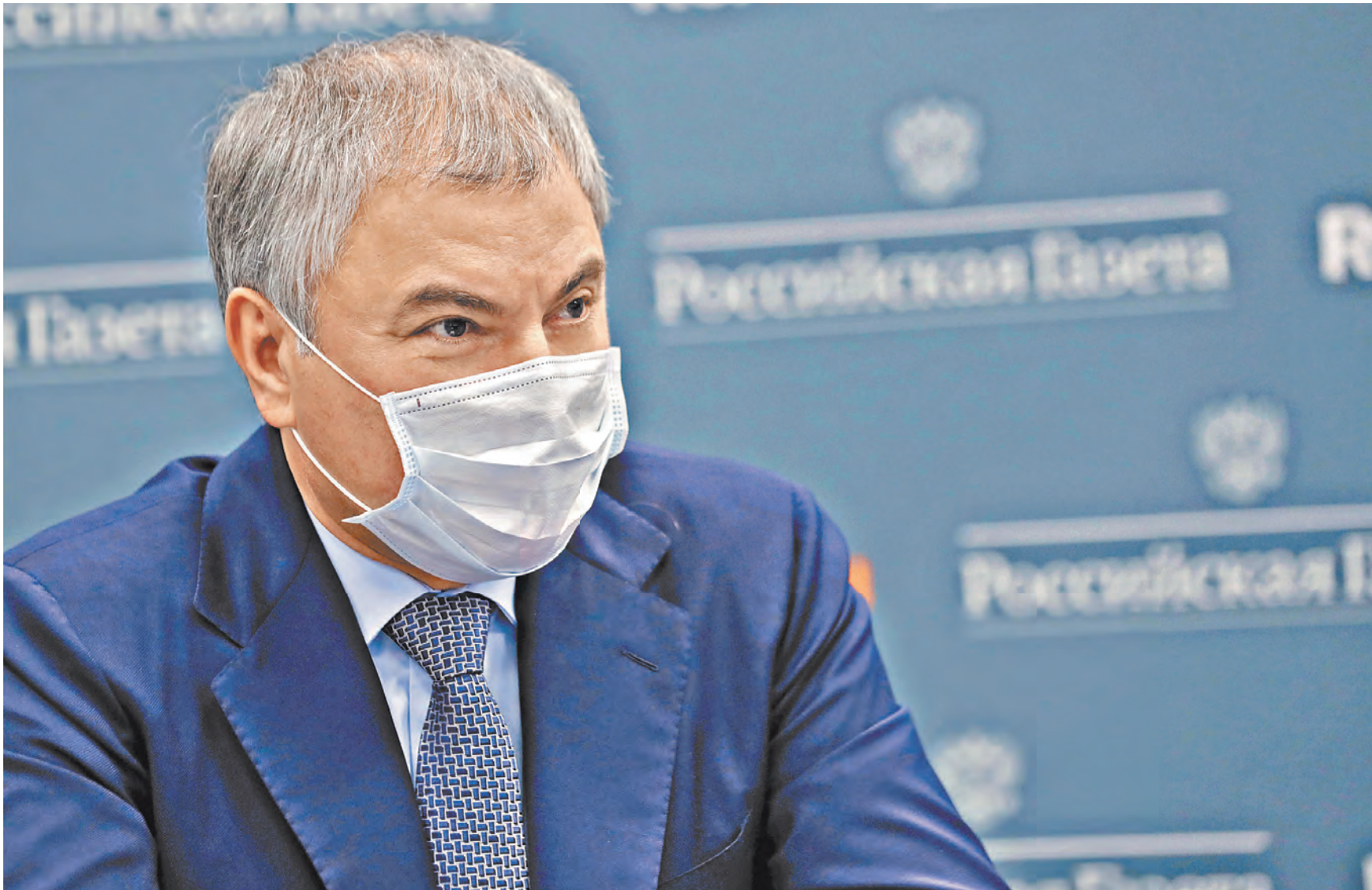
Вячеслав Володин: Сейчас у нас в законотворческом «портфеле» 1266 законопроектов, и из них примерно 20 процентов уже приняты в первом чтении.