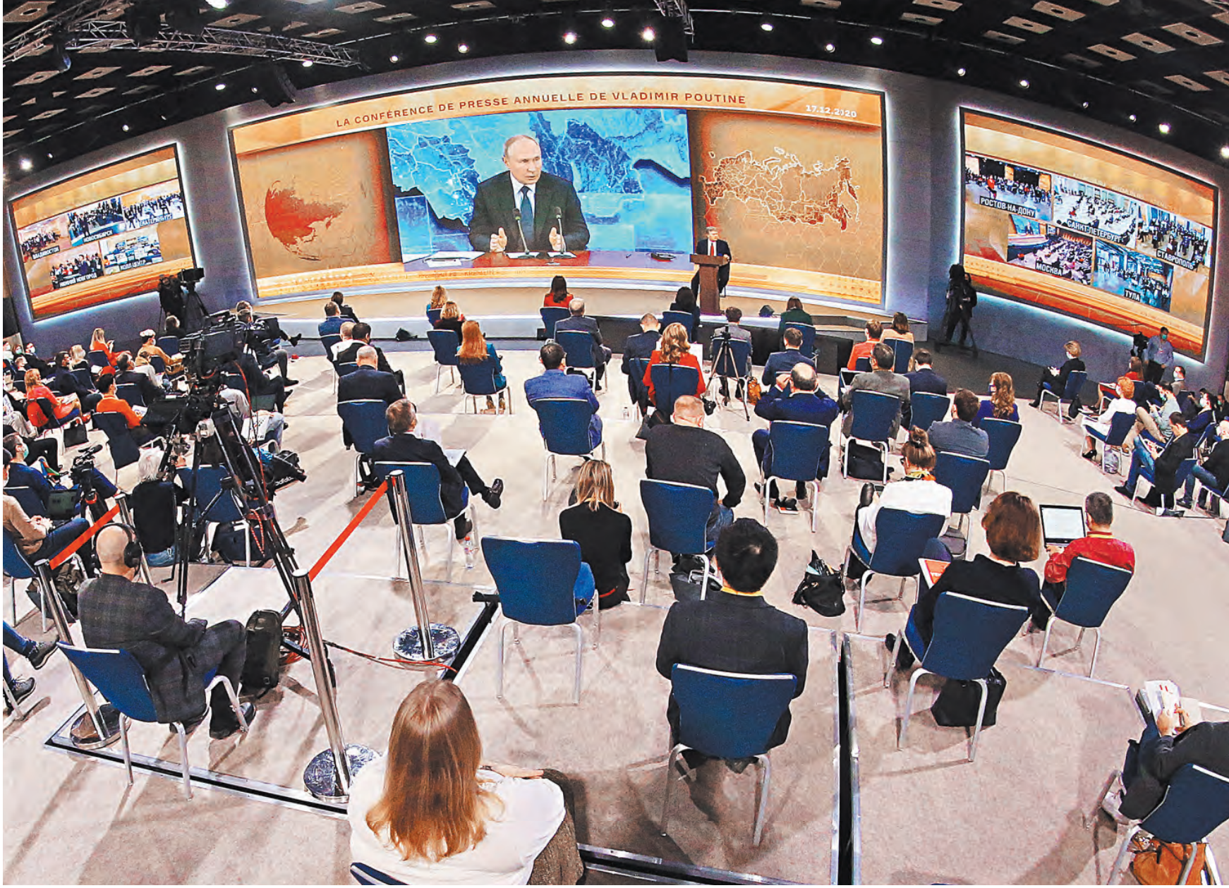
Нынешняя большая пресс-конференция стала для Владимира Путина шестнадцатой. Большую часть вопросов журналисты задали онлайн.