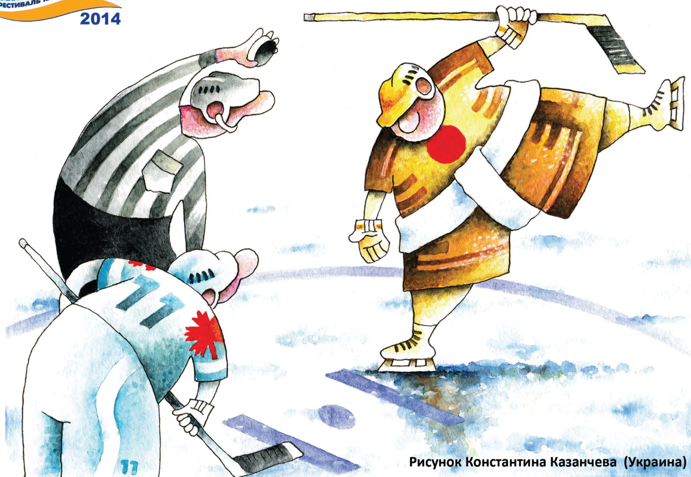
Рисунок Константина Казанчева (Украина)