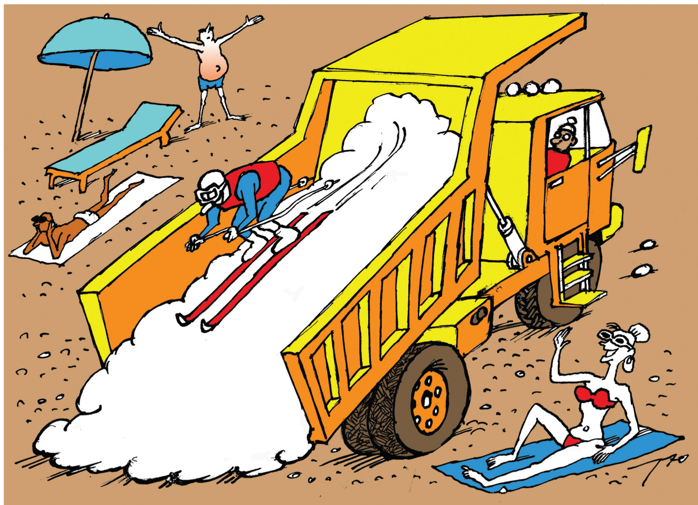
Рисунок Сергея Тюнина (Россия)