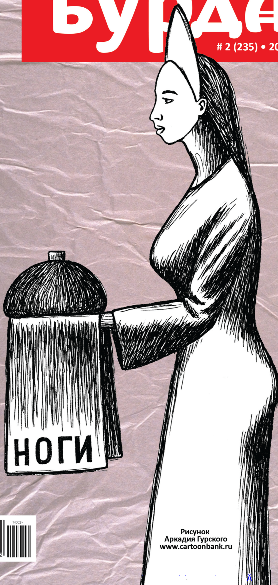
Рисунок Аркадия Гурского www.cartoonbank.ru