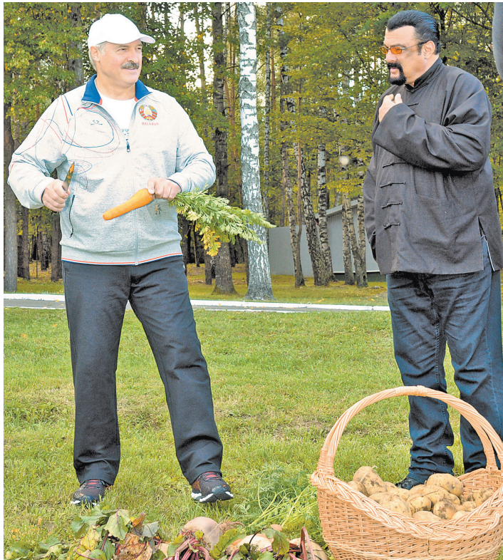
Александр Лукашенко угостил Стивена Сигала экологически чистой морковкой. И подарил фотоальбом о Беловежской Пуще.

Анонс / Репортеры «СОЮЗа» побывали внутри символа советской эпохи — скульптуры «Рабочий и колхозница» Парное стояние