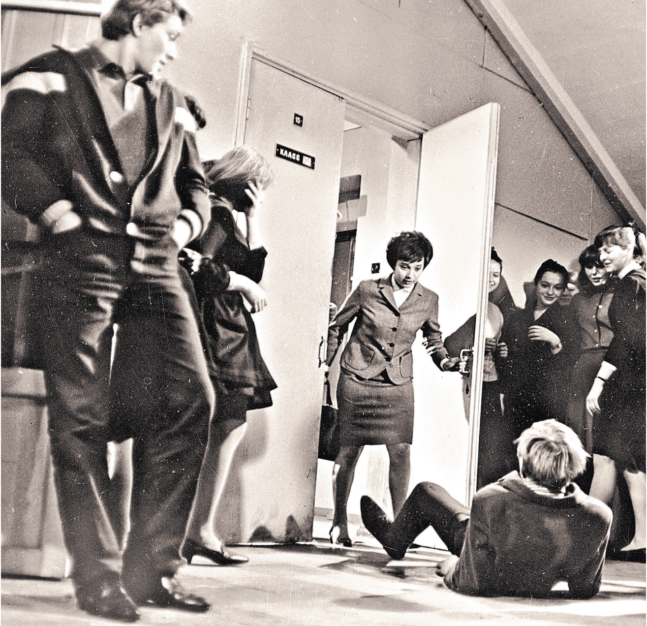
В советское время мелодрама Станислава Ростоцкого «Доживем до понедельника» заслуженно считалась одной из лучших картин о школьной жизни, о поиске смысла жизни, о любви. Некоторые из этих сюжетов прослеживаются и в «Семицветике».