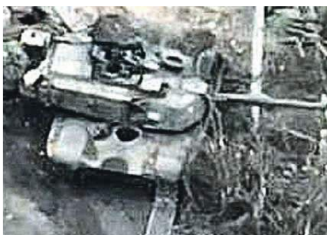
Кадр из видео