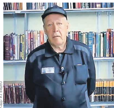
Кадр из видео