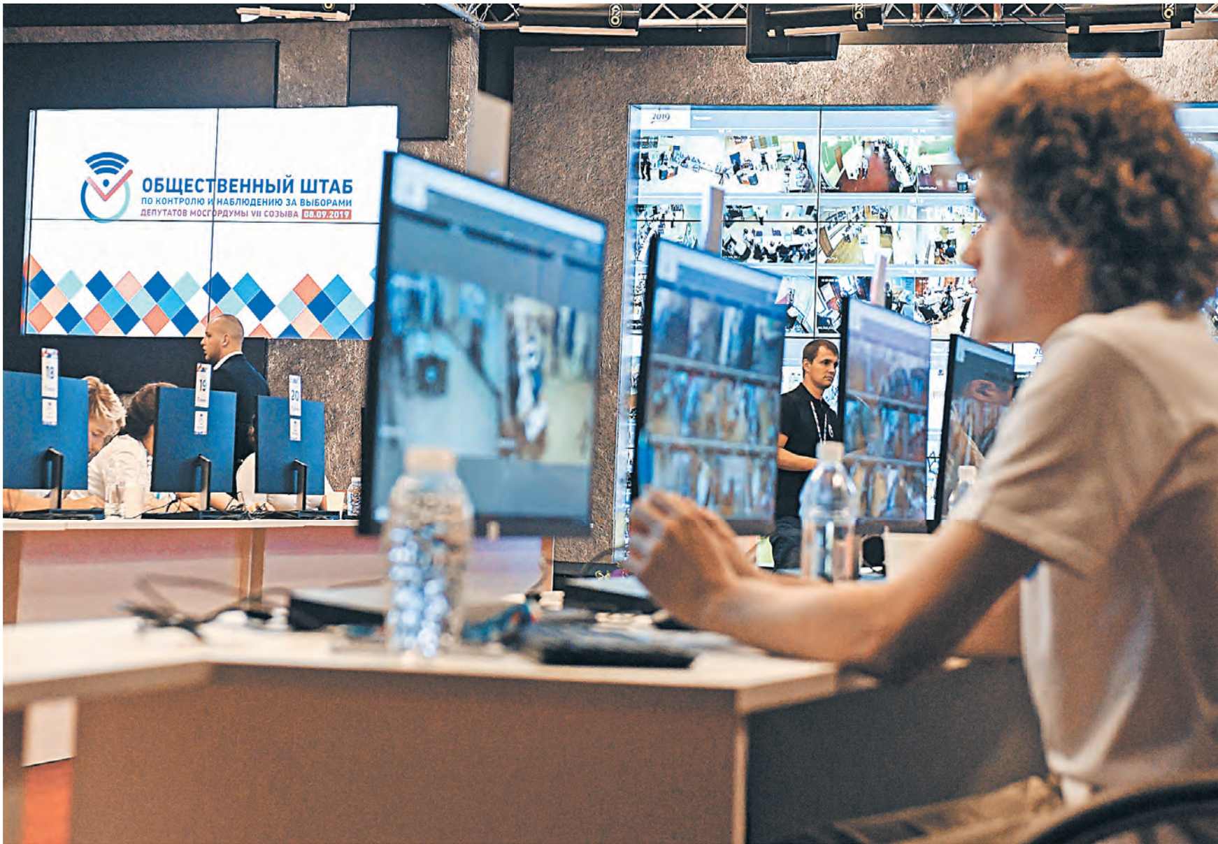
ИГОРЬ ИВАНКО / АГЕНСТВО ГОРОДСКИХ НОВОСТЕЙ МОСКВЫ