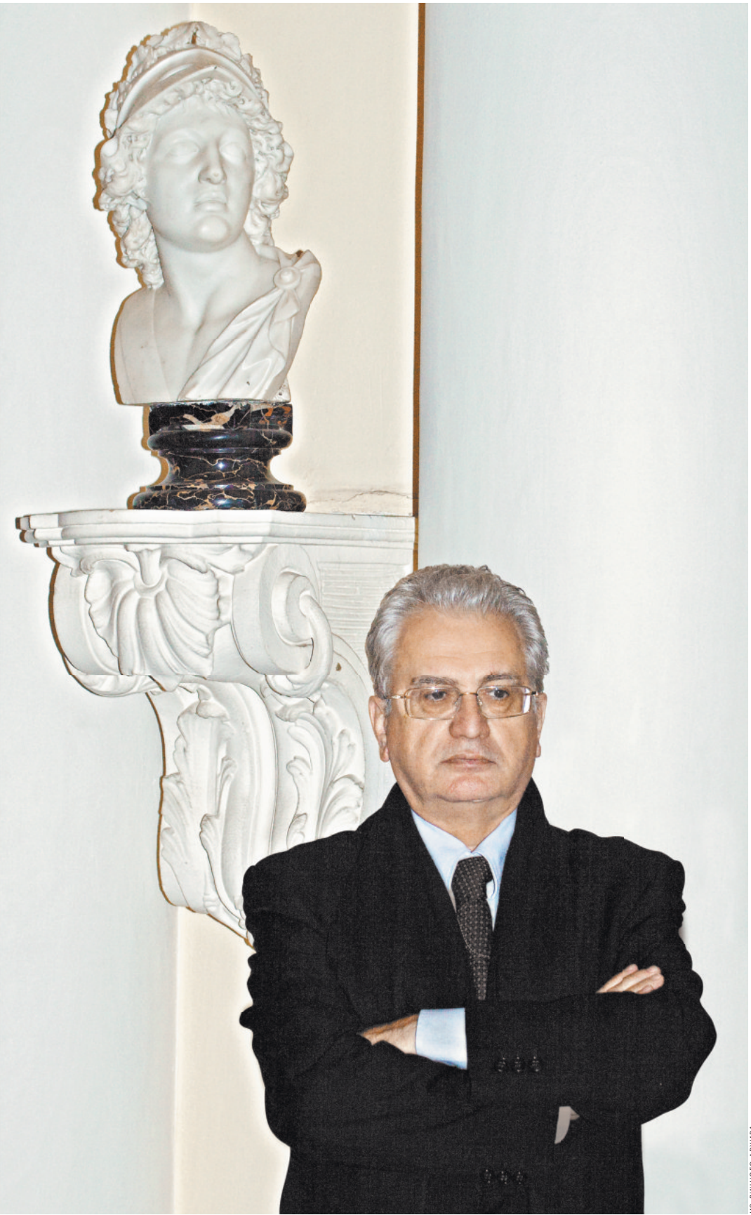
Михаил Пиотровский: Нам сказали — возьмите и сделайте хороший закон, и мы пошли его делать.

МИХАИЛ ПИОТРОВСКИЙ: Да. Мы начали ее разрабатывать после недольного разговора на Совете по культуре, мол, законы плохи, тен-