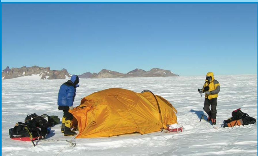
Передвижная гостиница в Антарктиде