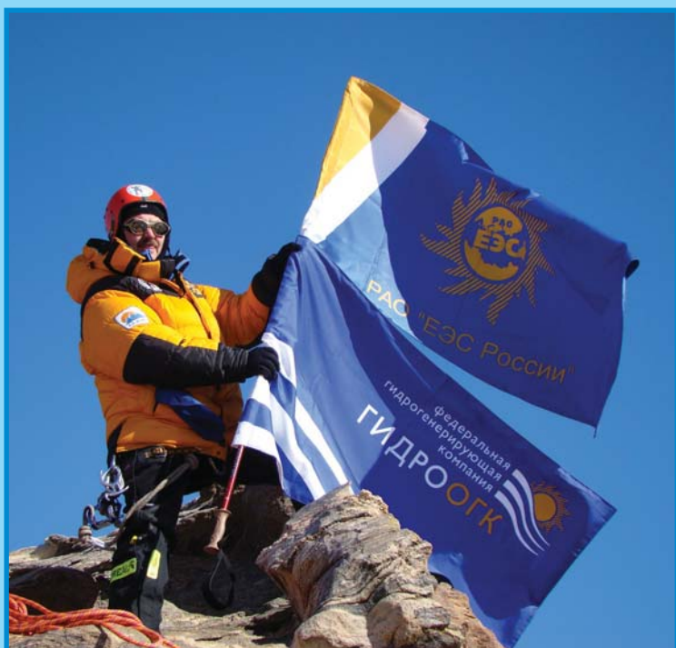
2 марта — покорена новая вершина