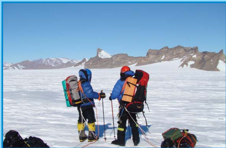
Горы Гумбольта уже близко