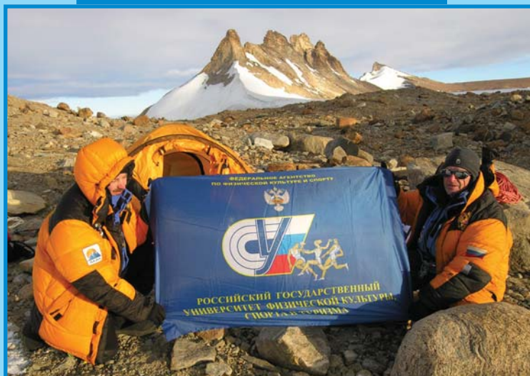
На вершине «90-летия РГУФКСиТ»