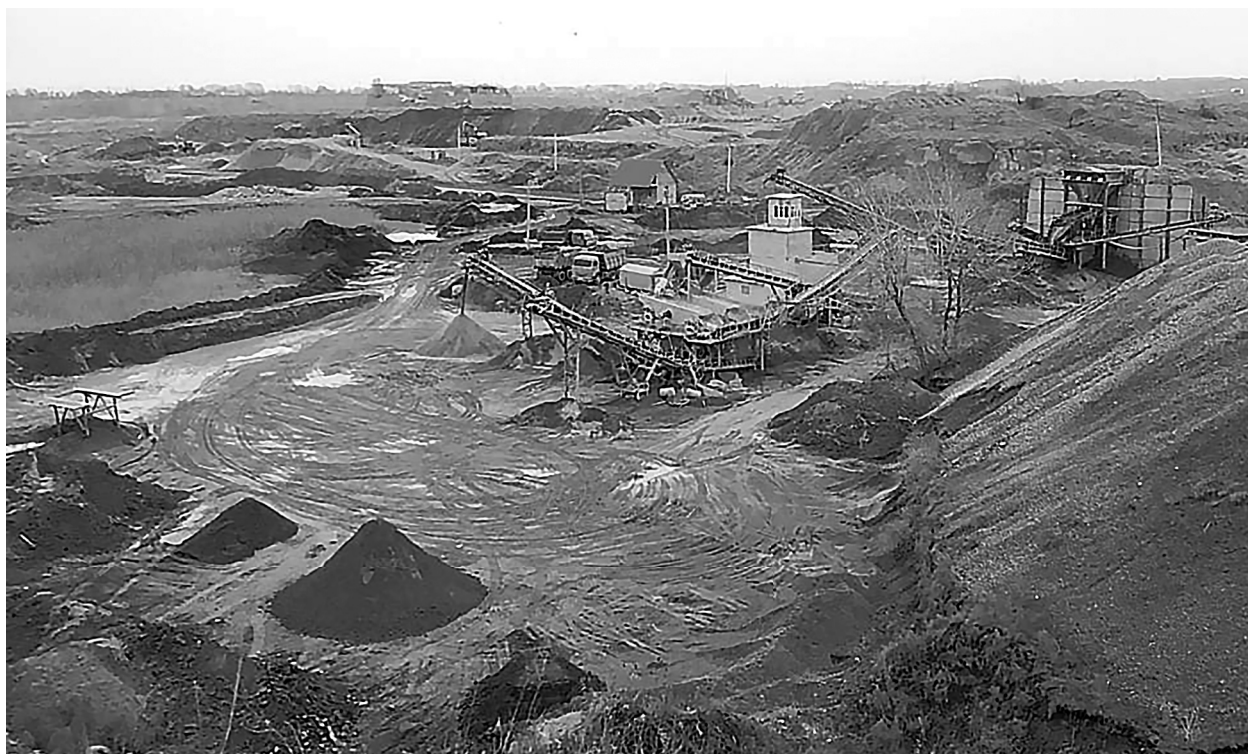
НАРОДНЫЙ ФРОНТ ДАГЕСТАНА

Карьеры возле поселков Дагестана губят экологию и здоровье их жителей