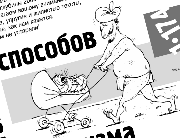
РИС. И. ВАРЧЕНКО (МОСКВА)