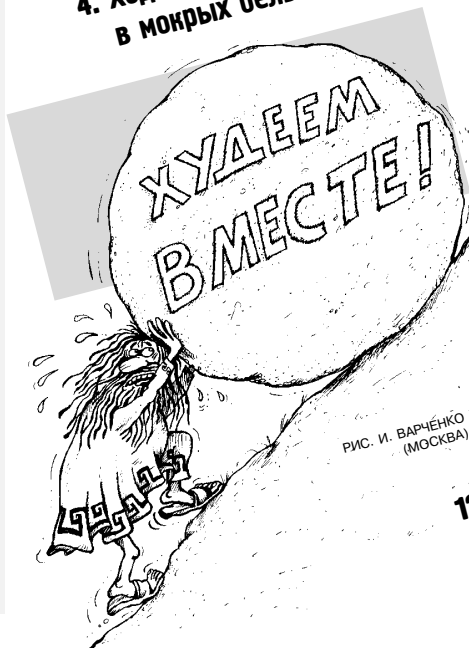
РИС. И. ВАРЧЕНКО (МОСКВА)