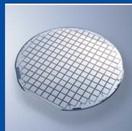
Быстрые диоды для новых поколений IGBT