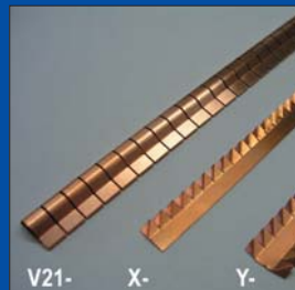
Особенности экранирования металлических корпусов с помощью контактных пружин