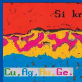
Сравнительная характеристика способов монтажа кристаллов MOSFET-транзисторов